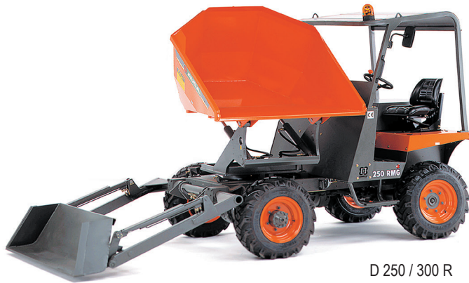
D 250 / 300 R