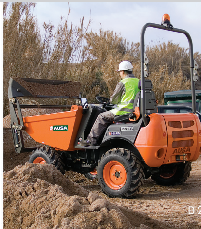
D 201 R