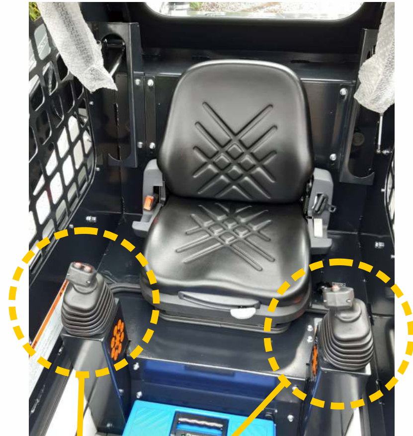
Operación por joysticks